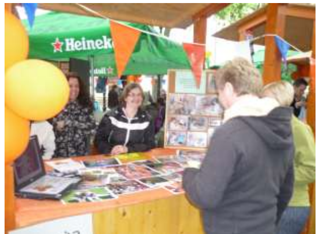
Obrázok 9: V prezentačnom stánku sa vystriedali spolu štyri zariadenia poskytujúce sociálne služby

V máji už tradične navštevujeme podujatia Dni mesta Hnúšťa. Veľmi sa nám páčili ukážky s činnosťami, ktorými sa prezentovali občanom Hnúšte policajti Okresného riaditeľstva policajného zboru v Rimavskej Sobote. Ukážka zásahu proti nebezpečnému ozbrojenému páchatelovi bola naozaj zaujímavá a my sme sa