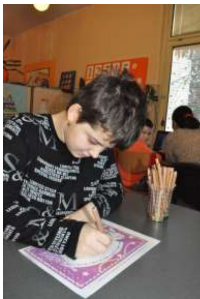
Obrázok 16: píšeme na papier aj ..