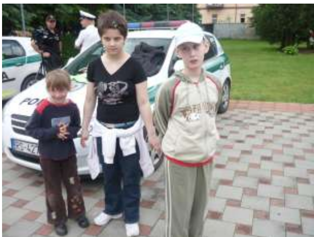
Obrázok 10: policajti sa nám veľmi páčili

Aby sme si okrem pekných zážitkov odniesli aj niečo navyše, nechali sme si vyzdobiť tváre farbami.