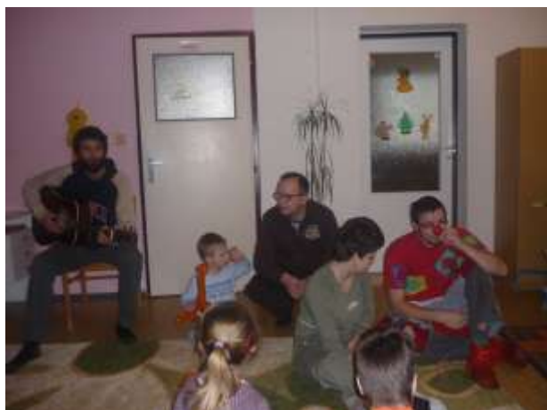
Obrázok 21: zábava a ...