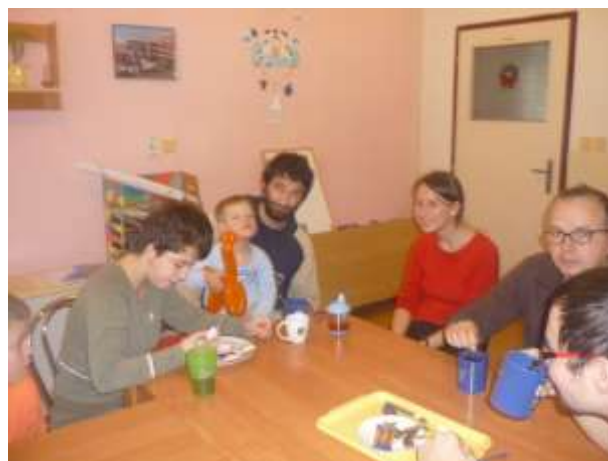
Obrázok 22: .....pohostenie