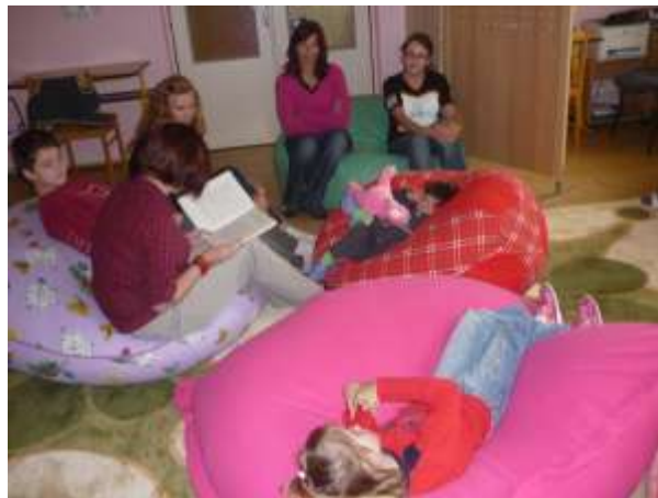
Obrázok 19: Deň dobrovoľníctva

V septembri sa konal 15. ročník Výtvarného salónu ZPMP 2010. Hoci naše kolektívne dielo nebolo ocenené, aj tak sa tešíme že sme sa tejto súťaže spojenej s výstavou mohli zúčastniť.