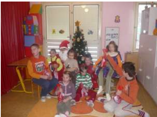
Obrázok 25: návšteva Mikuláša