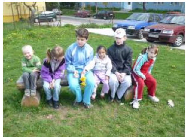
Obrázok 6: prechádzka v blízkom okolí