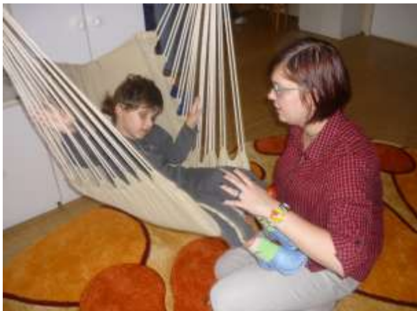
Obrázok 18: Deň dobrovoľníctva

Zavítali k nám štyri dobrovoľníčky, ktoré sa zapojili do spoločného programu s deťmi. Počas biblioterapie čítali deťom rozprávky, cez muzikoterapiu sme si spoločne zahrali na rôzne perkusie a s chuťou si zaspievali. Dobrovoľníčky sa potom hrali s jednotlivými deťmi rôzne hry podľa záujmu.