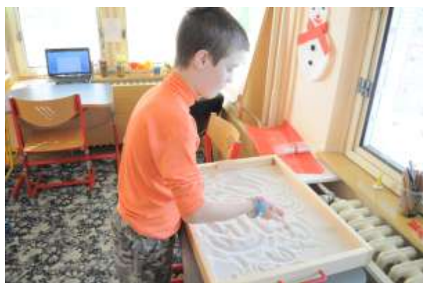
Obrázok 17: ...aj do piesku

V piatok, 10. septembra sa na Slovensku konal po druhýkrát Deň dobrovoľníctva, do ktorého sa tento rok zapojilo 78 rôznych organizácií, medzi ktorými bolo aj naše DEDESO. Otvorením dverí pre verejnosť sme chceli miestnej komunite priblížiť a