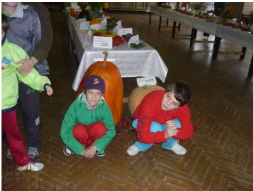
Obrázok 20: Výstava ovocia a zeleniny

V Kultúrnom dome v Hnúšti sa konala výstava zeleniny a ovocia. Ako aj iné školy, nenechali sme si to ujsť ani my.