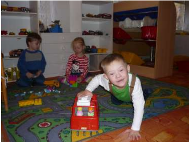
Obrázok 31: klient s rovesníkmi v materskej škole