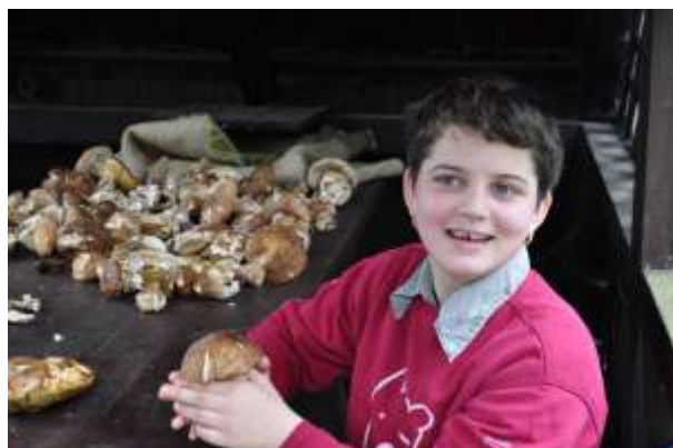
Obrázok 13: ešte krajšie hríby