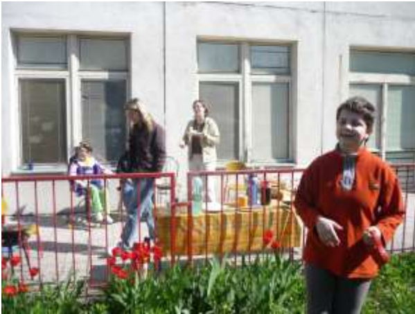
Obrázok 7: opekačka