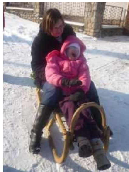
Obrázok 2: sánkovačka