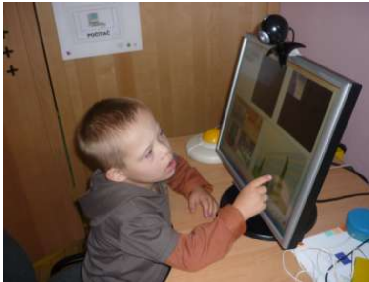
Obrázok 30: práca s FONO 2 programom

Na naplnenie cieľov sa využívali každodenné tréningy realizované pod supervíziou logopedičky, informačné a komunikačné technológie - práca s PC programom FONO 1 a 2 a rôzne didaktické pomôcky. Komunikačné zručnosti si klient mohol precvičovať počas reálnych situácií pri hre s deťmi v DEDESE, materskej škole, počas voľnočasových aktivít a v arteterapeutických dielňach. Celkový prejav klienta je dnes spontánnejší, je iniciatívnejší a bezprostrednejší pri kontakte s inými ľuďmi. Pri stretnutí s rovesníkmi je uvoľnenejší.