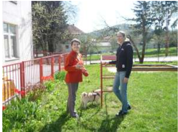
Obrázok 8: náš kamarát