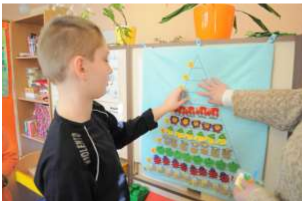
Obrázok 14: učíme sa počítať