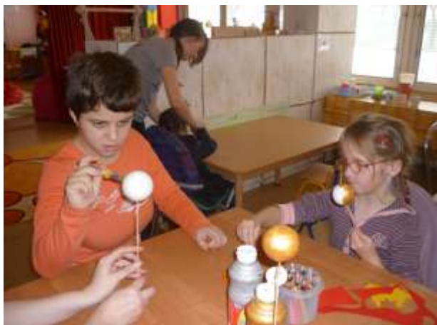
Obrázok 23: výroba ozdôb

ZŠ Klokočova a Mesto Hnúšťa už po štvrtý krát zorganizovali charitatívnu akciu NIE SI SÁM – predaj kapustnice počas vianočných trhov. Výťažok z predaja venovali