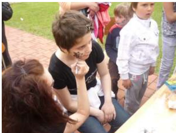
Obrázok 11: aj striga, ktorá naše tváre vyzdobila ornamentmi

Začali sme s realizáciou projektu grantového programu OPORA, ktorý je zameraný na tvorbu IPRO.