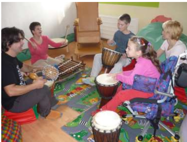
Obrázok 28: skupinová muzikoterapia s lektorom

Projekt "Bubnujeme pre radosť" podporený Nadáciou pre deti Slovenska v grantovom programe Hodina deťom pokračoval do júna 2010. Muzikoterapeutické stretnutia s lektorom OZ Drumbľa však pokračovali až do konca roka 2010. Projekt nám umožnil zakomponovať individuálne a cielečné muzikoterapie do Individuálnych programov rozvoja osobnosti. Pravidelnou a systematickou individuálnou alebo skupinovú muzikoterapiou sa nám podarilo u niektorých klientov stabilizovať ich emocionálnu stránku a redukovať agresívne prejavy v správaní.