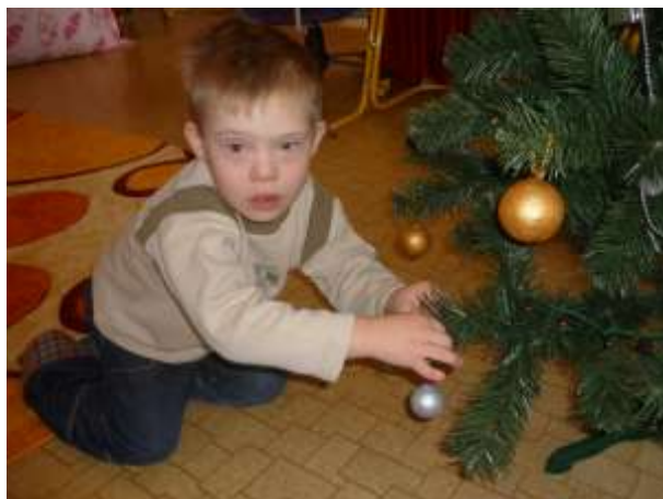
Obrázok 24: zdobenie stromčeka