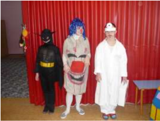
Obrázok 3: naše masky