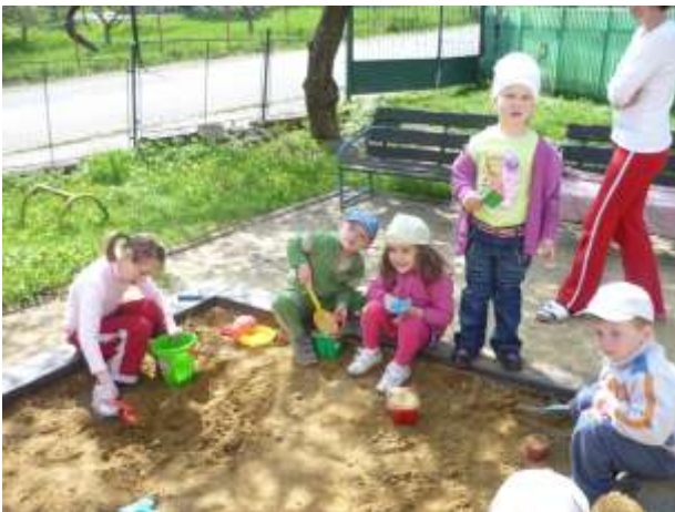
Obrázok 5: s deťmi z materskej školy

V marci začína jar a pekné dni nás lákajú stráviť viac času v záhrade a na pieskovisku. Nemôžeme však poľaviť ani v školských povinnostiach a naďalej sa venujeme rozvoju našich zručností.