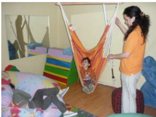
Obrázok 1: terapeutická miestnosť

V januári sme sa okrem sánkovačky pustili aj do zariaďovania terapeutickej miestnosti s prvkami bazálnej stimulácie. Miestnosť sme vybavili polohovacími vakmi, hojdačím závesným kreslom, svetelné efekty nám zabezpečuje disco guľa, plazmová guľa a glitter lampy. Miestnosť sa využíva okrem bazálnej stimulácie aj na muzikoterapeutické stretnutia