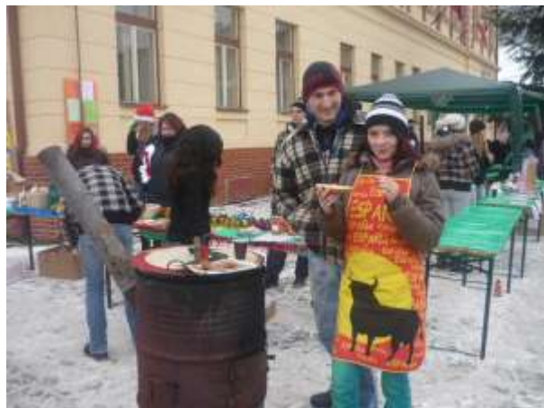
Obrázok 26: NIE SI SÁM - predaj kapustnice