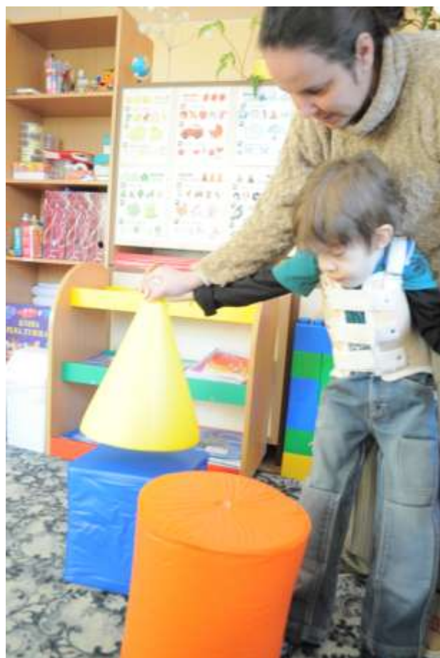
Obrázok 15: spoznávame tvary