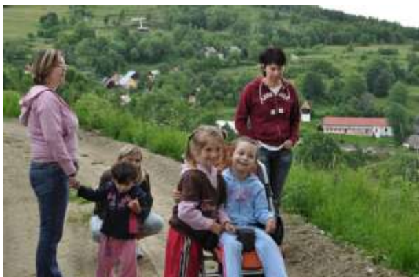
Obrázok 12: krásna príroda a ...

Na tohtoročný výlet sme vybrali na Krokavu a stálo to za to. Spoločnosť nám robili lúka, les a vtáčí spev. Podarilo sa nám aj nazbierať lesné jahody a hríby. Na čerstvom vzduchu nám chutili aj grilované dobroty, čo sme si pripravili.